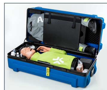
Borsa rigida per trasporto