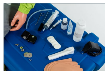
Accessori inclusi nella confezione