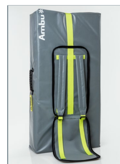
Borsa per il trasporto (materassino incluso)