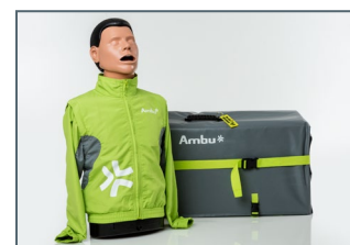
Ambu Man Airway Wireless Torso