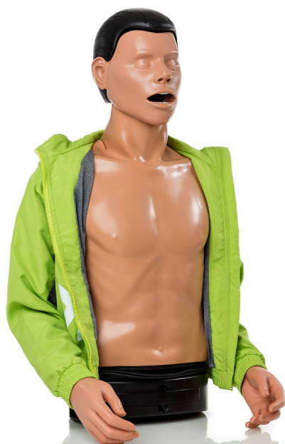
Braccia e gambe opzionali disponibili