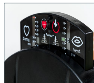
Display di monitoraggio